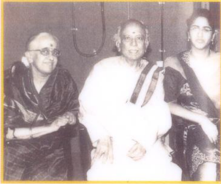
■ பேர்திபுள் வால்குடி தம்பதியினர்

கொடுக்கால் கொட்டியதுபோல் ஆனது வால்குடிக்கு. விழா மேடையில் நெளிந்தபடியே உட்கார்ந்திருந்தார். அன்று இரவே மெட்ராஸ் கிளம்பி வந்து, மறுநாள் செம்மங்குடியின் வீட்டுக்குச் சென்றார்.